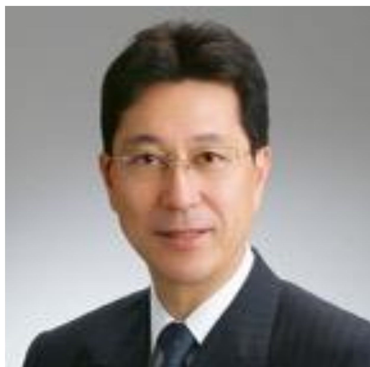
心臓血管外科 志水秀行 教授